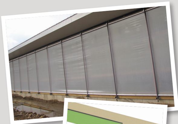
TOILE ROLL-UP SIMPLE ▶