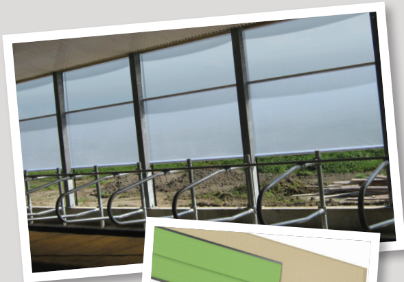
TOILE ROLL-UP DOUBLE ▶