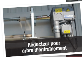
Réducteur pour arbre d'entraînement