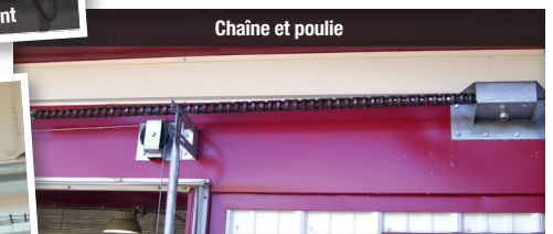
Chaîne et poulie