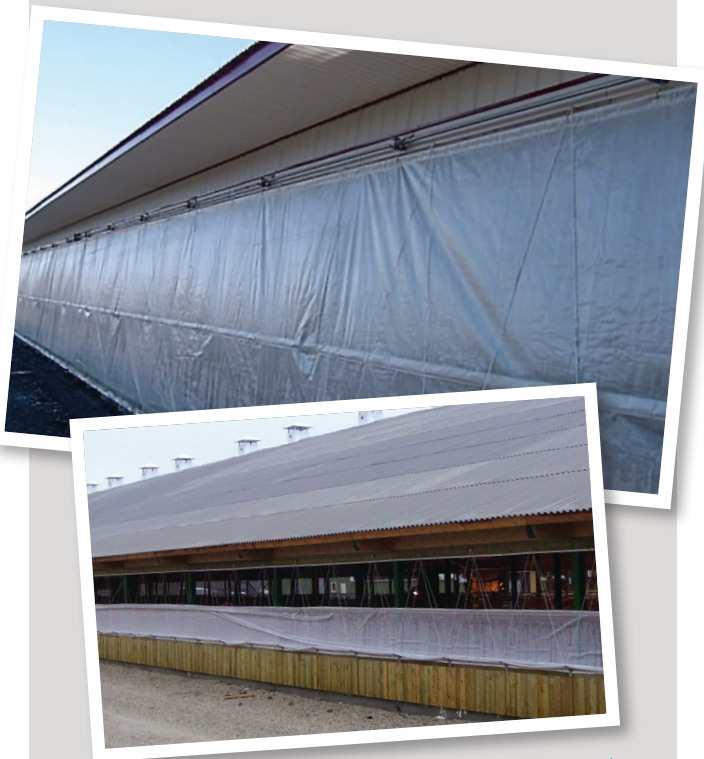
TOILE SIMPLE FIXE ▲ OU AMOVIBLE