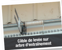
Câble de levée sur arbre d'entraînement